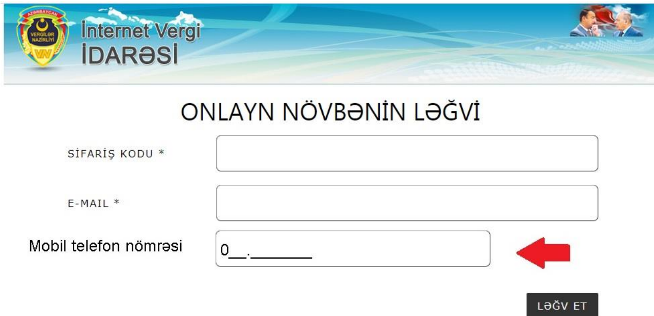
Şəkil 13. İnternet Vergi İdarəsində ( www.e-taxes.gov.az ) “Onlayn növbə” bölməsində “Növbəni ləğv etmək” xidməti.

İqtisadiyyat Nazirliyi yanında Dövlət Vergi Xidmətinin mərkəzlərinə müraciət etmək üçün öncədən növbəyə yazılmış şəxslər tutduqları növbəni ləğv etmək məqsədi ilə İqtisadiyyat Nazirliyi yanında Dövlət Vergi Xidmətinin İnternet Vergi İdarəsində ( www.e-taxes.gov.az ) “Onlayn növbə” bölməsində “Növbəni ləğv etmək” xidmətini seçir (Şəkil 13).