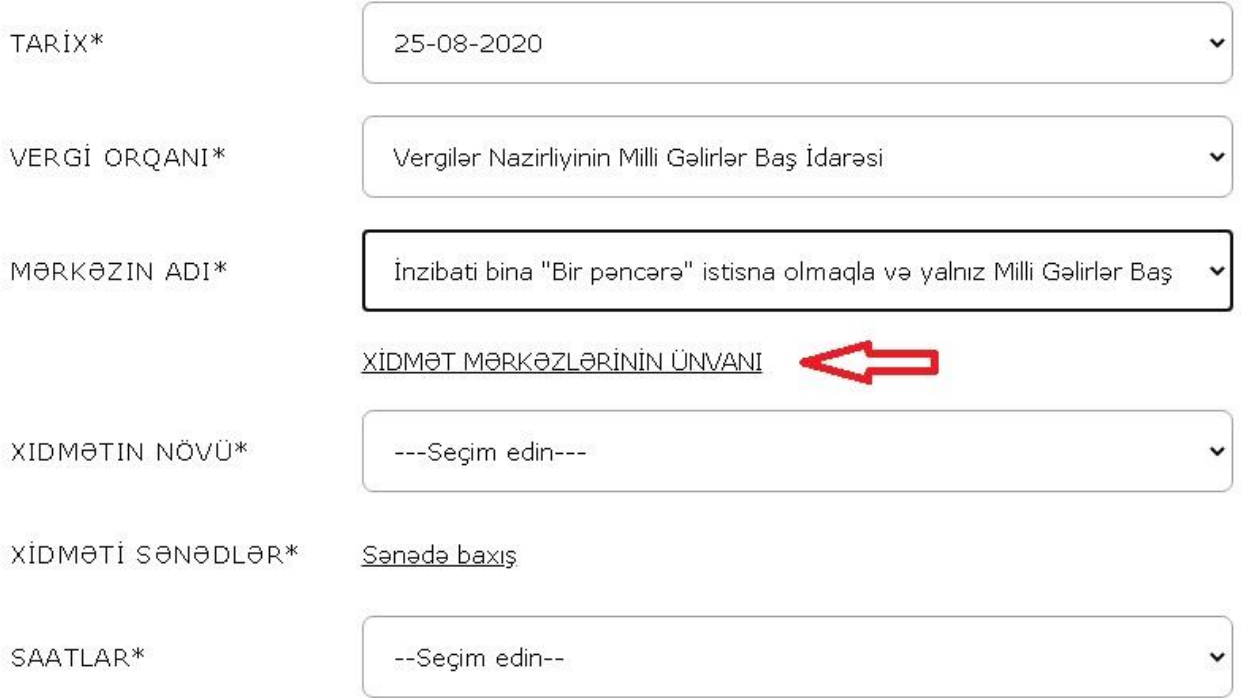
Şəkil 3. Xidmət mərkəzlərinin ünvanları.

“Hörmətli, vergi ödəyicisi! Koronavirus infeksiyasının (COVID-19) yayılmasının qarşısının alınması məqsədi ilə vergi ödəyicilərinə xidmət mərkəzlərinə yalnız zəruri hallarda, yeni əldə olunması nəzərdə tutulan xidmətin elektron analoqu olmadıqda müraciət etməyiniz Sizdən xahiş olunur.”