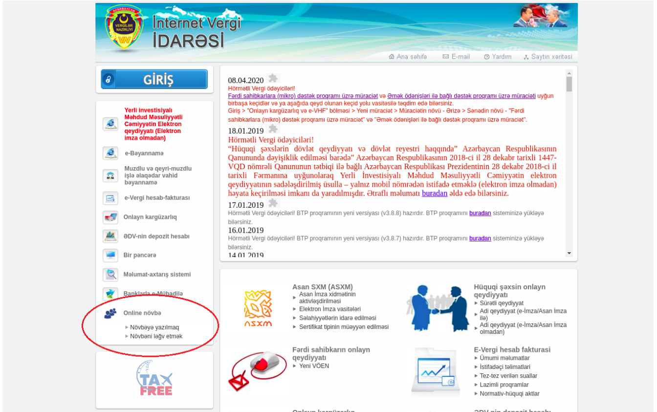
Şəkil 1. İnternet Vergi İdarəsində ( www.e-taxes.gov.az ) “Onlayn növbə” bölməsində “Növbəyə yazılmaq” xidməti.

İqtisadiyyat Nazirliyi yanında Dövlət Vergi Xidmətinin mərkəzlərinə müraciət edən şəxslər öncədən növbəyə yazılmaq üçün İqtisadiyyat Nazirliyi yanında Dövlət Vergi Xidmətinin İnternet Vergi İdarəsində ( www.e-taxes.gov.az ) “Onlayn növbə” bölməsində “Növbəyə yazılmaq” xidmətini seçir (Şəkil 1).